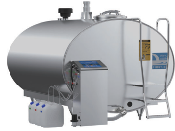
バルククーラー ※簡易点検のみ対象