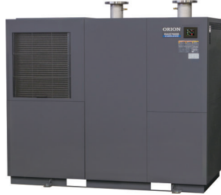
エアードライヤー